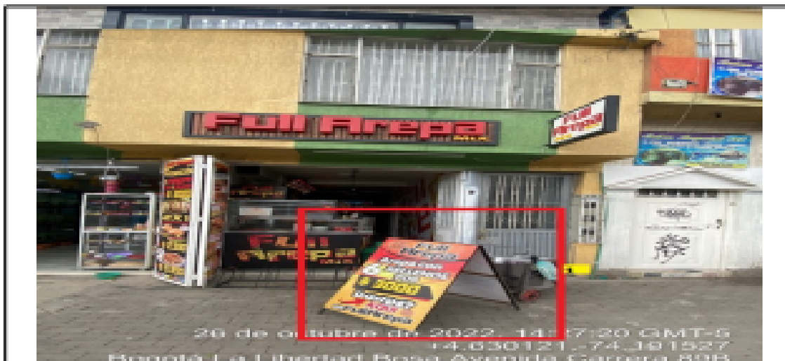
En la cual se evidencia un (1) elemento no regulado el cual se encuentra ubicado en área de espacio público perteneciente al establecimiento comercial denominado FULL AREPA MIX, y es adicional al único permitido.