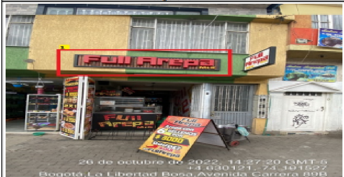
En la cual se evidencia un (1) elemento tipo aviso en fachada ubicado en antepecho de segundo piso perteneciente al establecimiento comercial denominado FULL AREPA MIX, el cual al momento de la visita se encontraba instalado sin el registro ante la SDA.