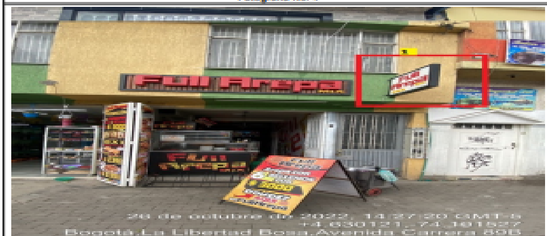
En la cual se evidencia un (1) elemento PEV perteneciente al establecimiento comercial denominado FULL AREPA MIX, el cual se encuentra volado de la fachada y es adicional al único elemento permitido por fachada de establecimiento comercial.