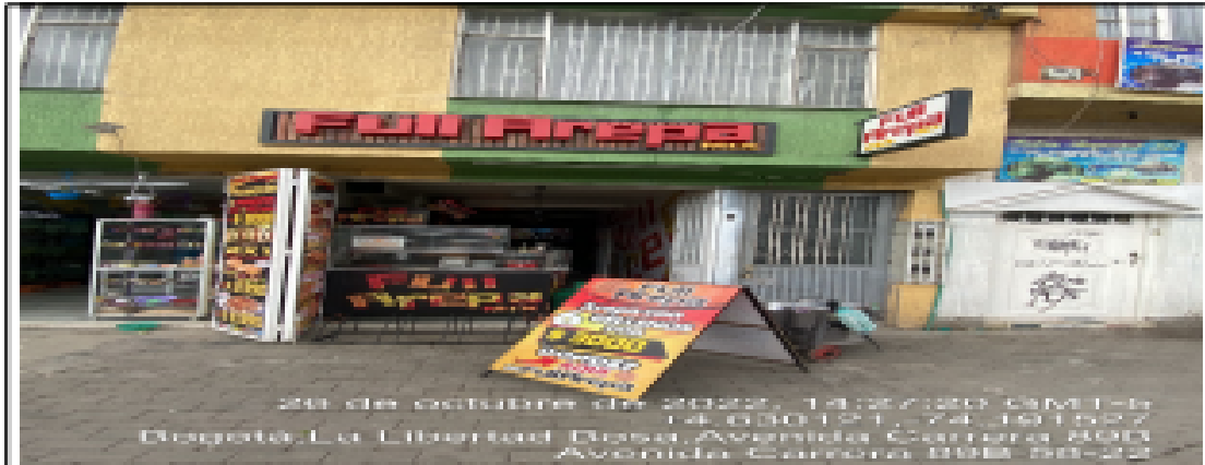
En la cual se evidencia la fachada del establecimiento comercial denominado FULL AREPA MIX, en la CR: 89 B No. 58 A - 41 Sur localidad de Bosa.